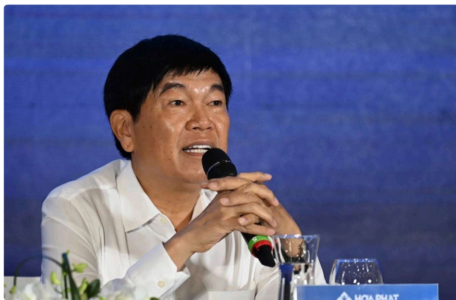
Tỷ phú Trần Đình Long tại ĐHĐCĐ thường niên 2025 của Hòa Phát