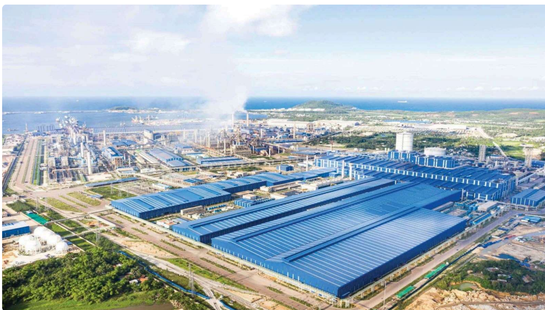
Khu liên hợp sản xuất gang thép Dung Quất 2